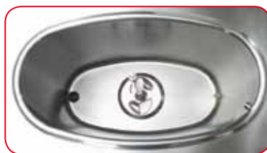
Vasca ellittica in acciaio con agitatore centrale