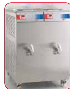
Pastmatic mod. 2x60