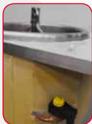
Valvola per il controllo del raffreddamento di metà vasca

Raffreddamento intelligente grazie alla divisione in due pezzi della superficie di raffreddamento della vasca che automaticamente (e anche manualmente) permette di raffreddare la stessa per intero o solo per metà: si ottiene così delicatezza nel raffreddamento delle pastorizzate e si mantengono le stesse alte qualità anche quando la quantità in vasca è minore.