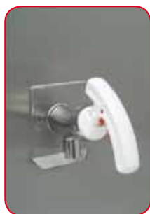
Erogatore in posizione chiusa